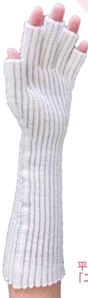
平編み弾性グローブ 「エアボ・ウェーブ グローブ」