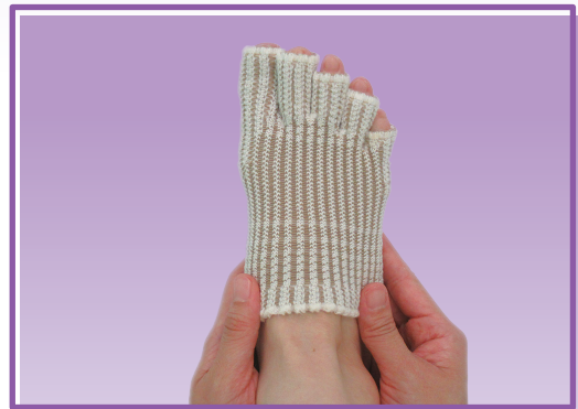
④ 足全体の密着感を整えます