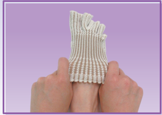
② 全体をゆっくり引き上げます