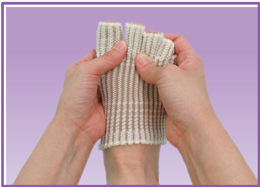
③ 足指のつけ根の位置を整えます