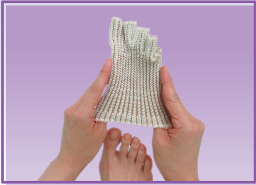
① トウキャップに足先を入れます